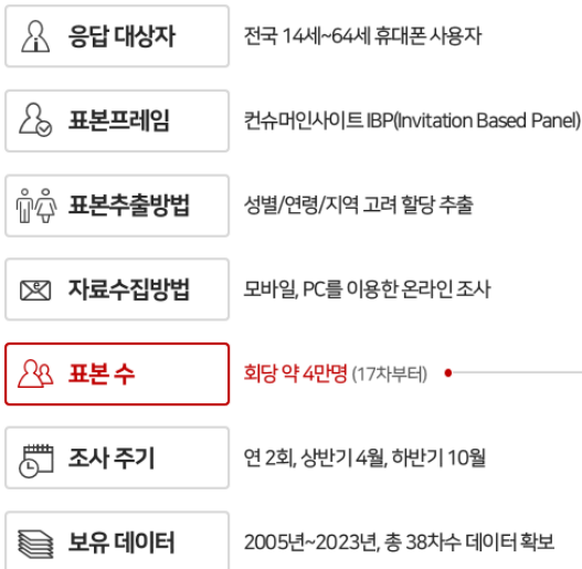
[누적 표본구성 현황] 총 2,273,066명